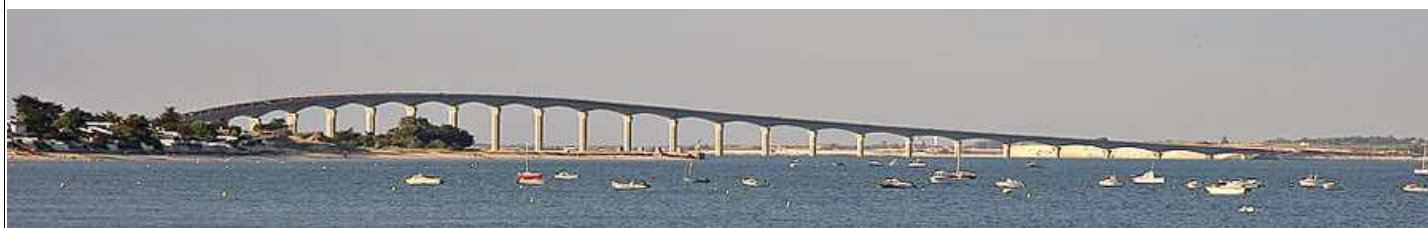
Pont de l'Île de Ré, inauguré en 1988. La longueur totale de l'ouvrage est de 2927 m, avec des portées de 110 m.

Grâce au béton précontraint, de nouvelles méthodes de construction ont été mises en oeuvre, permettant la réalisation de ponts en béton dans des zones géographiques difficiles, et avec des formes légères.