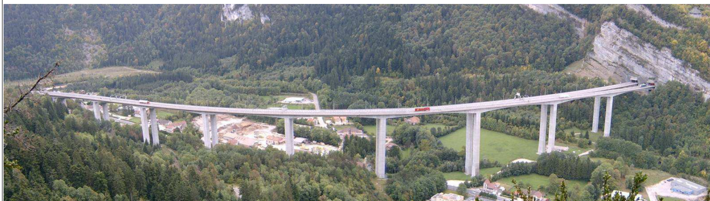
Viaduc de Nantua, ouvrage sur l'A40, inauguré en 1988.